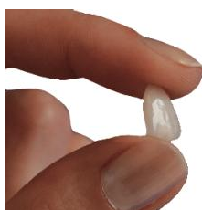
Veneer: Hauchdünne Schale aus Keramik

In allen diesen Fällen können mit Veneers ästhetische und ansprechende neue Zähne gestaltet werden. Wenn Sie Wert auf natürlich schön aussehende Zähne legen, die lange halten, sich nicht verfärben und die Ihre Zähne und Ihr Zahnfleisch schonen, sind Veneers die richtige Lösung für Sie!