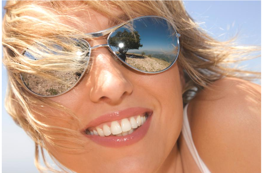
Wenn man schöne weiße Zähne hat, kann man unbefangen reden und lachen. Es macht Spaß, solche Zähne zu zeigen!

Außerdem sollten die Zähne vor der Aufhellung professionell gereinigt werden: Wenn noch Beläge auf den Zähnen sind, kann das Aufhellungsmittel nicht richtig wirken. Aus all dem sehen Sie: