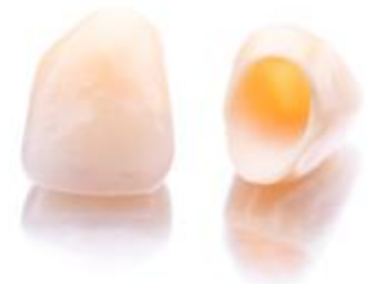
Ästhetische Kronen aus reiner Keramik

Wenn Sie noch andere Metalle im Mund haben (z.B. Amalgam, herausnehmbaren