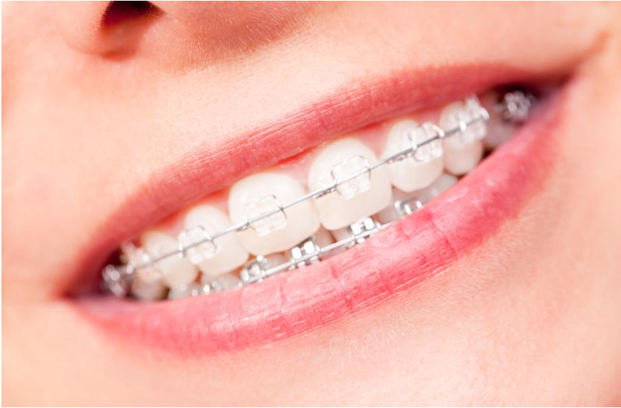
Neben Farbe und Form ist die harmonische Stellung der Zähne wichtig für das gute Aussehen. Bei Kindern sind Zahn-Regulierungen heute selbstverständlich. Aber wie ist es, wenn man als Erwachsener schiefstehende Zähne hat? Bis zu welchem Alter kann man die Zähne regulieren?

Wenn Zähne sehr schief stehen oder wenn der ganze Biss nicht stimmt: