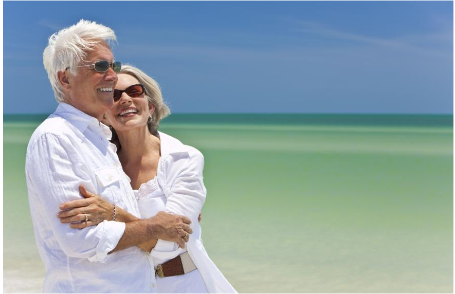
Mehr Spaß und Lebensqualität mit Zahnersatz aus reiner Keramik: Keine sichtbaren Metallteile. Kein Metallgeschmack im Mund. Gleichbleibend schöne Farben. Natürliches Aussehen.