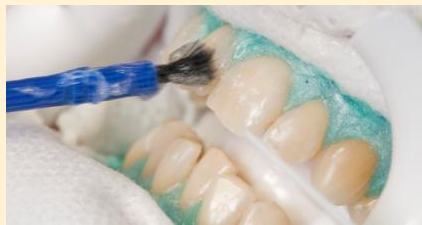
Power-Bleaching in der Zahnarztpraxis: Nachdem das Zahnfleisch zum Schutz abgedeckt wurde, wird hochkonzentriertes Bleaching-Gel auf die Zähne aufgetragen. Nach ein bis eineinhalb Stunden sind die Zähne deutlich heller.

So bezeichnet man im Englischen das schnelle Aufhellen in der Zahnarztpraxis. Dabei werden die Zähne vorab gereinigt und das Zahnfleisch mit einem speziellen Schutz abgedeckt.