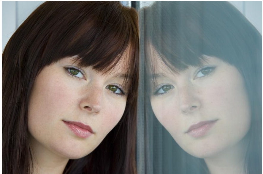
Wer unzufrieden mit dem Aussehen seiner Zähne ist, traut sich oft nicht, sie zu zeigen. Wie können Zähne schöner gemacht werden? Wie funktioniert Bleaching? Was sind Veneers? Hier bekommen Sie die Antworten.