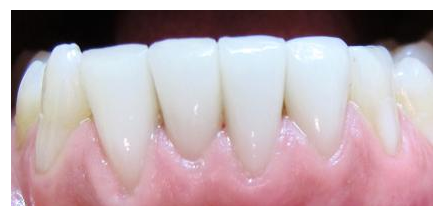
Veneers der unteren vier Schneidezähne (vor 4 Jahren eingesetzt): Das Zahnfleisch ist hell rosa und absolut gesund. Keine Verfärbung der Veneers.

Obwohl Veneers so grazil sind, halten sie sehr lange: Nach unserer Erfahrung 15 Jahre und länger! Veneers sind nicht nur für die Zähne schonend, sondern auch für das Zahnfleisch: Sie laufen zum Zahnfleischrand hin ganz dünn aus und reizen es daher nicht. Man sieht auch keinen Übergang vom Veneer zum Zahn.