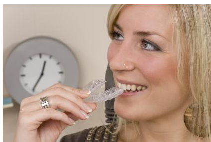
Invisalign: Kieferorthopädische Regulierung mit durchsichtigen Kunststoff-Folien

die sogenannte Invisalign -Technik. Das sind durchsichtige Kunststoff-Folien, die Sie selbst bei Bedarf in den Mund einsetzen. Sie sind so gestaltet, dass sie die Zähne nach und nach sanft regulieren.