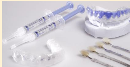
Home-Bleaching-Set: Bleaching-Gel (links oben) und Trägerfolie (links unten), die mit dem Bleaching-Gel über die Zähne gestülpt wird. Rechts oben das Gipsmodell, auf dem die Trägerfolie hergestellt wurde.

Beim Home-Bleaching hellen Sie Ihre Zähne zu Hause auf. Die dafür notwendigen Hilfsmittel erhalten Sie vom Zahnarzt. Er kontrolliert vorab, ob Ihre Zähne für das Bleichen geeignet sind und lässt