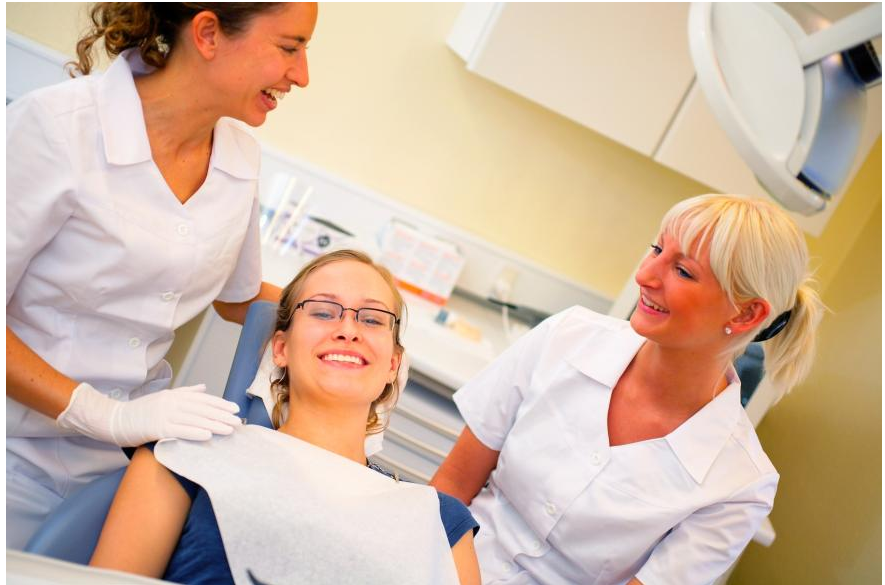
Regelmäßige Professionelle Zahnreinigungen in der Praxis haben viele Vorteile: Ihre Zähne sehen danach besser aus. Sie schützen sich vor Karies, Parodontose und Mundgeruch. Und Sie haben wieder einen frischen Atem.

Beläge sind nicht nur ein kosmetisches Problem: Sie können auch Karies (Löcher in den Zähnen) und Parodontose (Zahnlockerung) verursachen. Außerdem