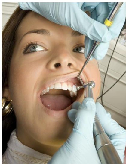
Entfernung des Zahnbelags mit speziellen Bürsten und Polierpasten

Der beste Weg zu schöneren und gesunden Zähnen ist also immer deren sorgfältige Pflege zu Hause und die regelmäßige Professionelle Zahnreinigung in der Praxis.