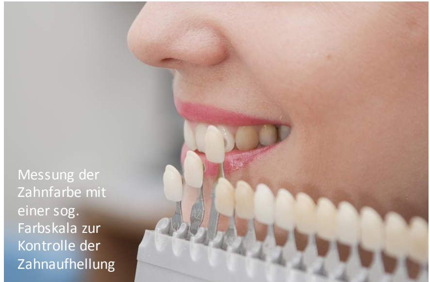
Messung der Zahnfarbe mit einer sog. Farbskala zur Kontrolle der Zahnaufhellung

Wer seine Zähne aufhellen lassen will, steht vor der Wahl: Selber machen mit Mitteln aus dem Internet oder aus dem Drogeriemarkt? Oder doch lieber vom Zahnarzt, weil man sich da besser aufgehoben fühlt?