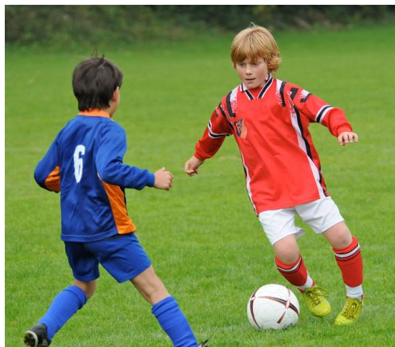
Gerade beim Sport kommt es oft vor, dass Zähne durch Stöße abbrechen. Wie können solche abgebrochenen Zähne wieder repariert werden? Welche Folgeschäden können auftreten?

Wenn Zähne zu kurz sind, ist es oft am besten, sie mit Veneers dauerhaft zu verlängern.