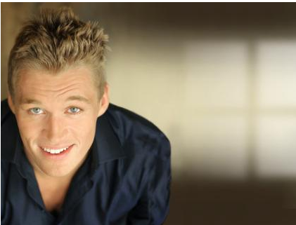
Zähne können jederzeit einfach und schnell wieder nachgehellt werden.

Ist das Nachdunkeln ein Problem? Eigentlich nicht! Die Zähne können jederzeit wieder nachgehellt werden. Das geht viel schneller als bei der ersten Aufhellung und ist preisgünstiger.