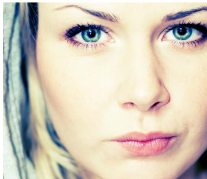
Was kann man machen, wenn nur ein einzelner Zahn auffällig dunkel ist?

Der Zahnarzt öffnet den Zahn von der Innenseite her und füllt das Bleichmittel ein. Die Öffnung ist also von vorne nicht