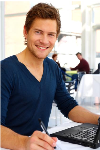
Keine Füllung zu sehen dank moderner Komposits (keramikverstärkte Kunststoffe, die sich farblich den Zähnen anpassen). Sie lassen sich so auf Hochglanz polieren, dass sich keine Farbstoffe mehr einlagern. Die Füllungen bleiben lange Zeit schön.

Schöner als Amalgam und Gold. Besser als einfache Kunststoffe.